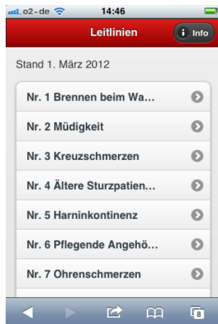
Figure 1: Screenshot start screen

Depending on the contents of the guidelines (for instance nested charts) use was also made of collapsible submenus, zoomable diagrams, flow charts and interactive decision trees as well as static and dynamic algorithms (see Figure 2).