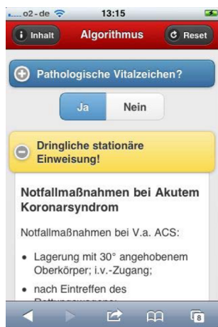
Figure 2: Screenshot dynamic algorithm with collapsible submenus for guideline no. 15 – chest pain

Depending on the contents of the guidelines (for instance nested charts) use was also made of collapsible submenus, zoomable diagrams, flow charts and interactive decision trees as well as static and dynamic algorithms (see Figure 2).